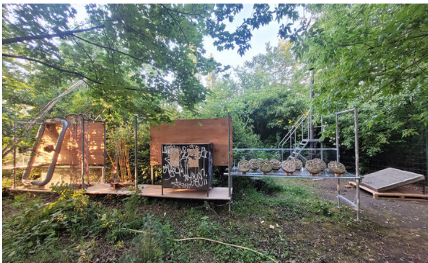
Ansicht aus der Ausstellung: „The Stories We Inhabit“ im Kunstraum IDEAL / Schulze-Delitzsch-Straße 27: ein Schaulager mit den Kunstobjekten aus dem Bürgergarten

Für das Depot und die Ausstellung entsteht eine neue Ausstellungsarchitektur. So wird ein Lagersystem für die ehemals ortsspezifischen Kunstwerke entstehen, das die Ortsverschiebung der Objekte thematisiert