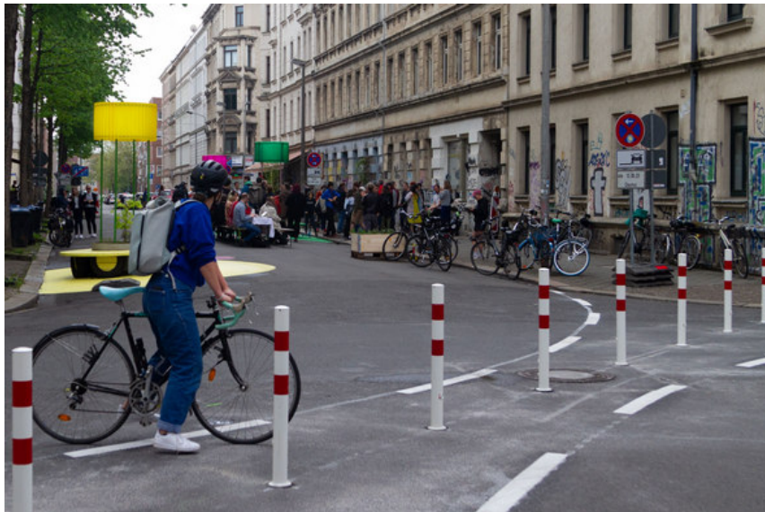
Kollektiv Plus X_Diagonalsperrung, Eröffnung Mai2023, VeloCity Superblock 1

Ab dem 16. September 2024 lädt der Verein zu Aktionen und Gesprächs-