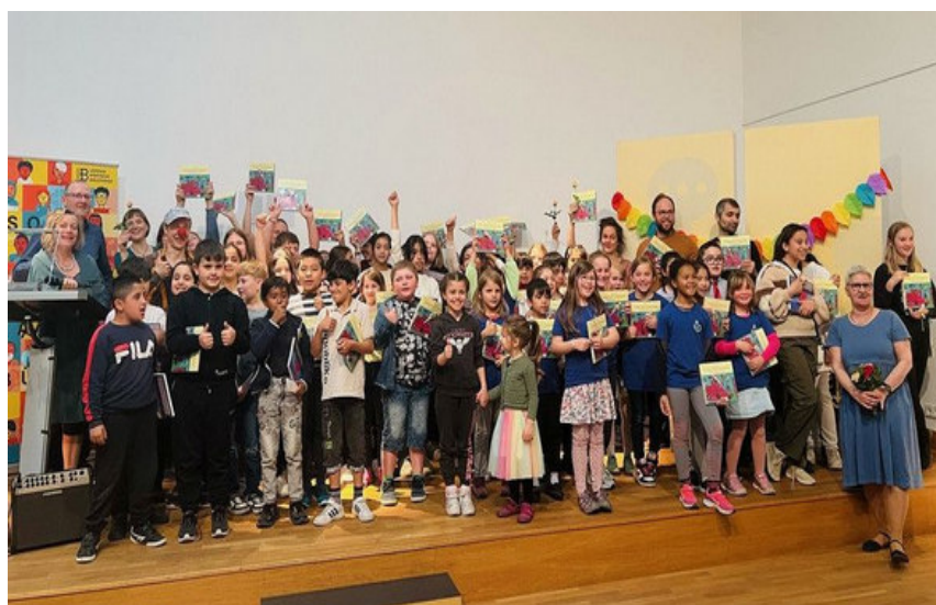
Buchvorstellung 50 Verse für Pferdinande

Seit Beginn des Schuljahres ist die Schulbibliothek wieder an mittlerweile vier Tagen in der Woche stundenweise geöffnet und wird von zwei ehrenamtlich tätigen Eltern sowie einem Schulassistenten betreut. Die Schüler*innen nutzen die Bibliothek gerne als Rückzugsort oder für Spiele und Bastelarbeiten. Darüber hinaus werden natürlich Bücher für den Unterricht und für die Freizeit ausgeliehen und es werden Fragen zu verschiedensten Themen (von Religion über Geografie bis hin zu Sexualität) gemeinsam diskutiert. Die Betreuer*innen wie auch die Kinder selber greifen regelmäßig zu Büchern und lesen vor. Im kommenden Schuljahr soll es weitere Angebote geben, wie